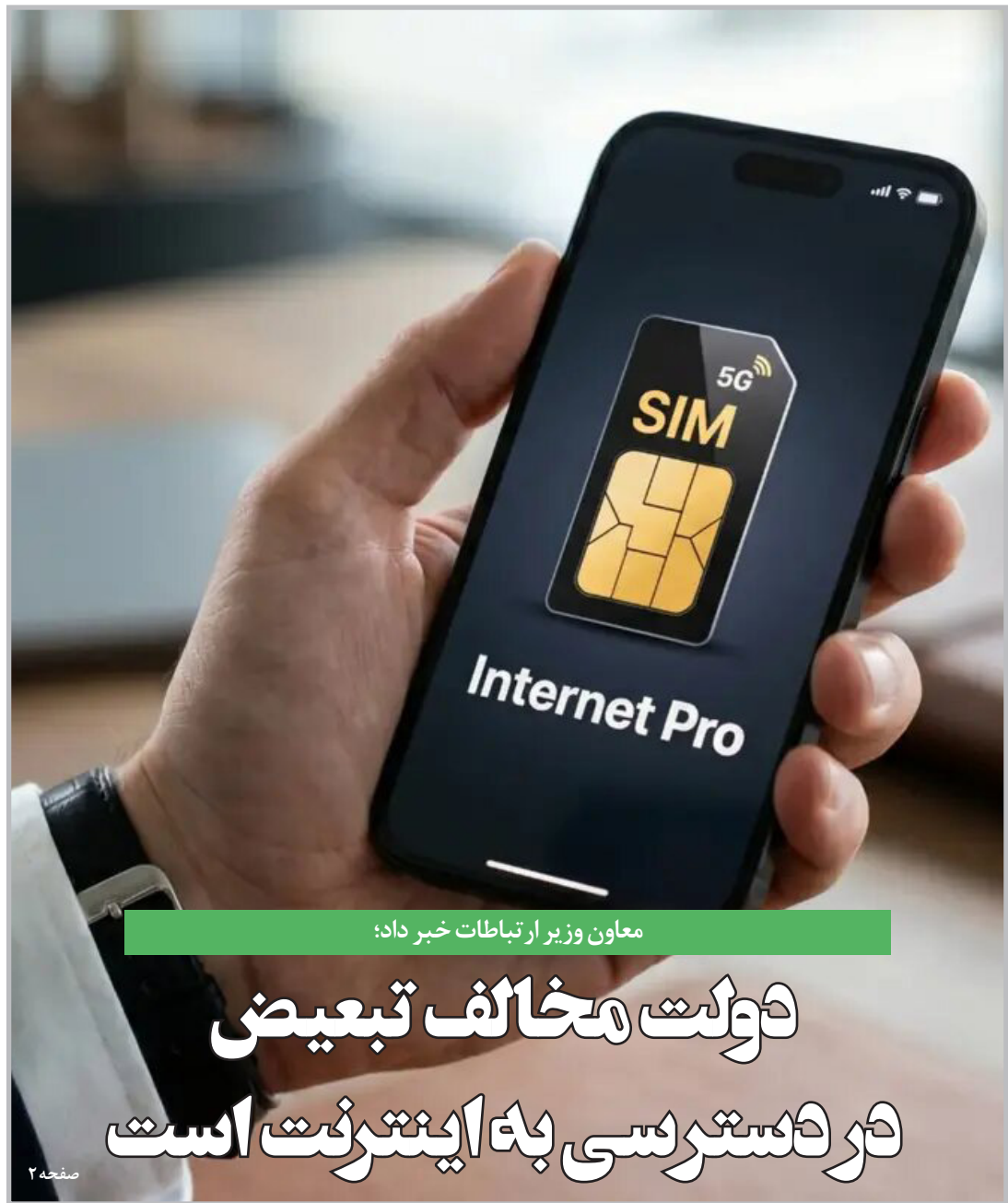
معاون وزیر ارتباطات خبر داد: