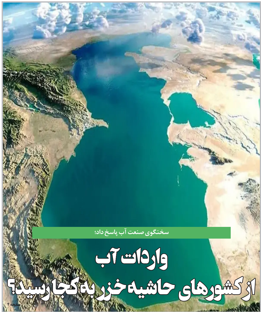
سختگویی صنعت آب پاسخ داد؛