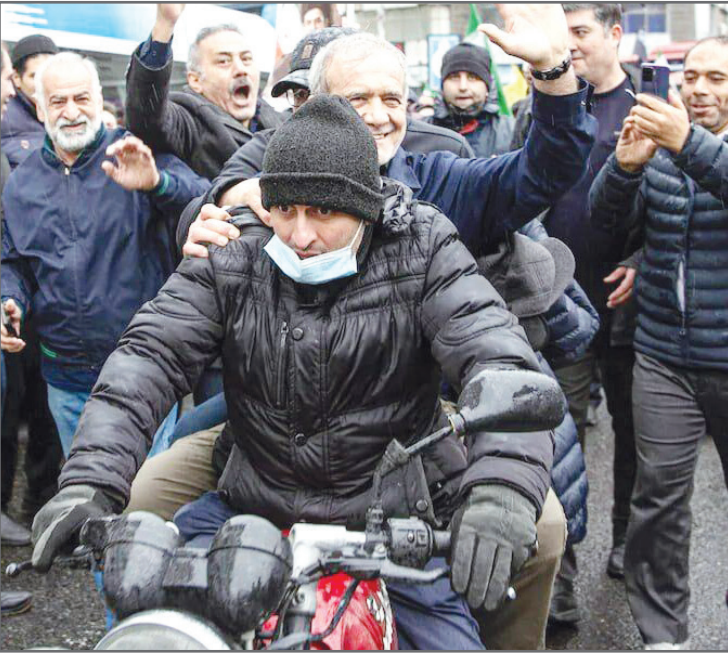
رئیس‌جمهور ایران، سیدعلی خامنه‌ای

می‌تواند با پر کردن شکاف میان مردم و مسئولین به تقویت «سرمایه‌های اجتماعی» منجر شوند و کارکرد عملی پیدا کنند که شهروندان ایران، حکمرانان را افرادی در دسترس ببینند که با تصمیم‌پذیری در میانه بحران به میان آنها آمده و در معرض آسیب‌ها و خطراتی قرار گیرند که این روزها در کمین افراد کوچک و بازار از خردسال تا کهنسال است.