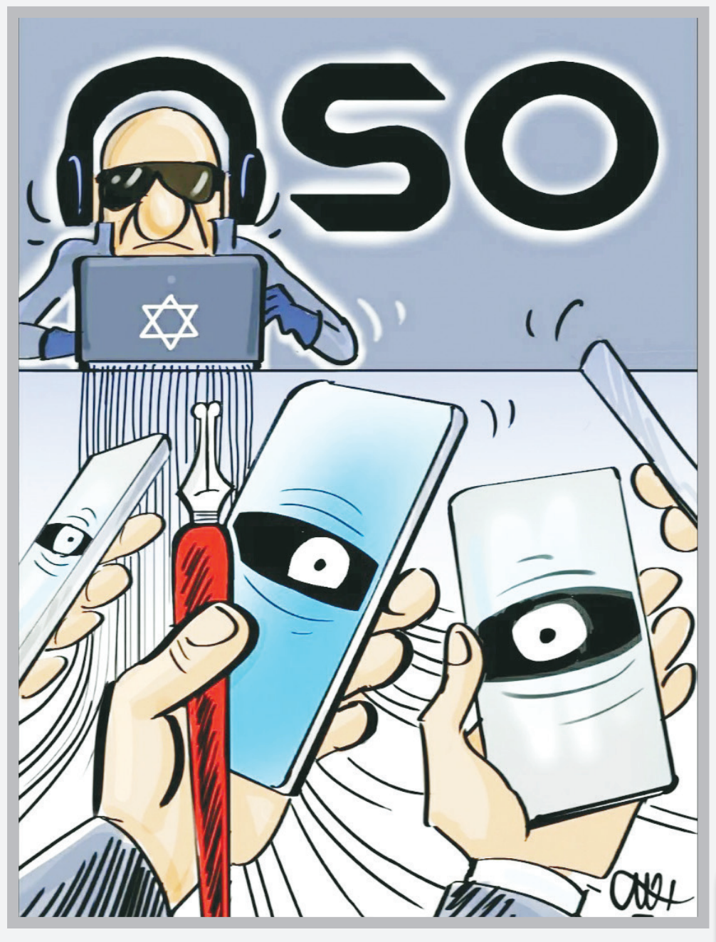
نرم‌افزاهای جاسوسی اسرائیل / محمدعلی رجیبی