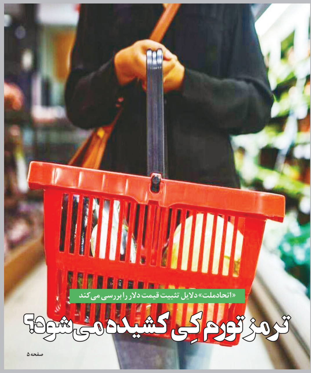
«اتحادملت» دلایل تثبیت قیمت دلار را بررسی می کند

رئیس مرکز ملی هوا و تغییر اقلیم سازمان محیط زیست تاکید کرد پسماندسوزی تشدیدکننده آلودگی هوا