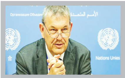
مقام سازمان ملل مطرح کرد

به گزارش خبرگزاری مهر به نقل از الجزیره، «فیلیپ لازارینی» کمیسر کل آژانس امدادرسانی سازمان ملل برای آوارگان فلسطینی «آنروا» تاکید کرد: اسرائیل برای مهاجرت اجباری و دسته جمعی ساکنان نوار غزه از این منطقه تلاش می کند. وی در ادامه افزود: بحران انسانی در نوار غزه در