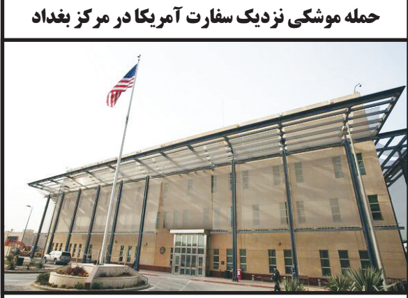
حمله موشکی نزدیک سفارت آمریکا در مرکز بغداد