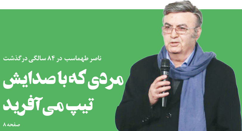
ناصر طهماسب در ۸۴ سالگی درگذشت