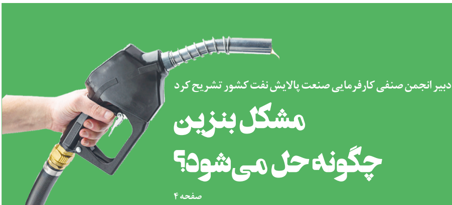
دبیر انجمن صنعتی کار فرمایی صنعت پالایش نفت کشور تشریح کرد