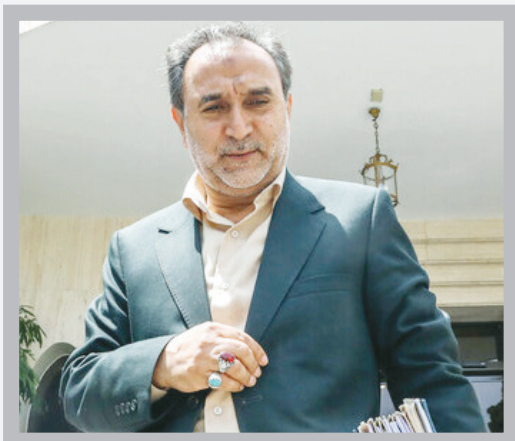
امیرعبداللهیان در نشست خبری: