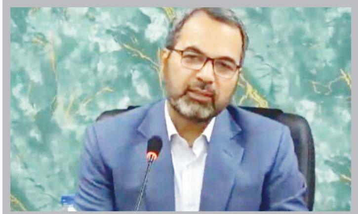
وزیر امور خارجه مصر سامح شکرى

وی اظهار امیدواری کرد نشست فردای اتحادیه عرب پیام قوی در حمایت از مردم فلسطین و محکومیت تجاوزات صهیونیست‌ها در بر داشته باشد. وزیر خارجه مصر سامح شکرى، ضمن محکوم کردن اقدامات تل آویو در بمباران غزه و کشتار غیرنظامیان، ارزیابی خود را از تحولات منطقه بیان کرد. سامح شکرى بر ضرورت برقراری آتش بس فوری و توقف حملات طرفین تأکید کرد. وی افزود: در خصوص ارسال کمک‌های انسانی کشورهای اسلامی به غزه از مسیر سازمان ملل هماهنگی خواهد شد. وزیر امور خارجه ایران و مصر با اشاره به گفتگوهای سازنده اخیر در نیویورک، اهتمام دو کشور برای عادی‌سازی روابط و از بین بردن سوء تفاهمات، را مبتنی بر اراده سیاسی دو طرف دانستند.