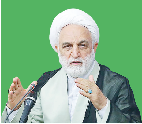
رئیس قوه قضاییه: