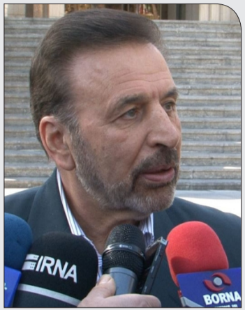
رئیس دفتر رییس جمهوری: