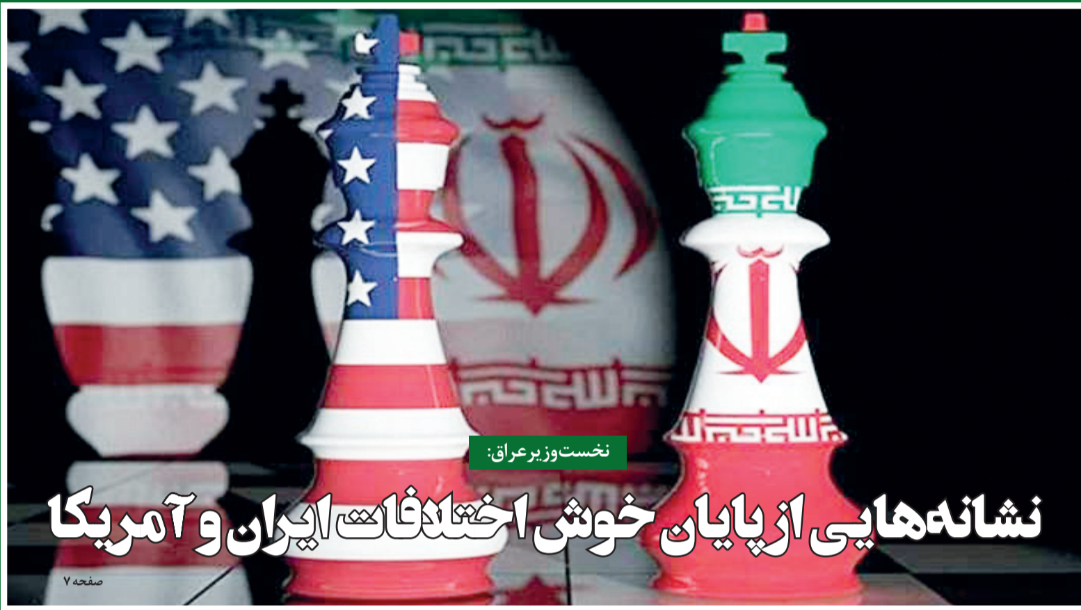
نخست وزیر عراق: