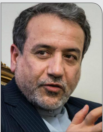
معاون وزیر امور خارجه در مورد اظهارات اخیرش توضیح داد