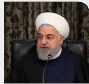
در نشست مشترک هیأت وزیران با استانداران

پنجشنبه ۲۷ دی ۱۳۹۷ • سال دوم • شماره ۳۳۱ • ۸ صفحه • ۱۰۰۰ تومان