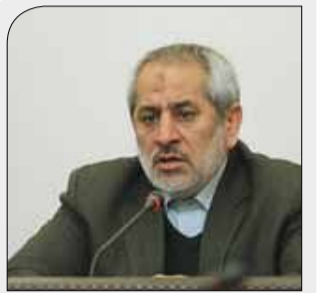
دادستان تهران مطرح کرد