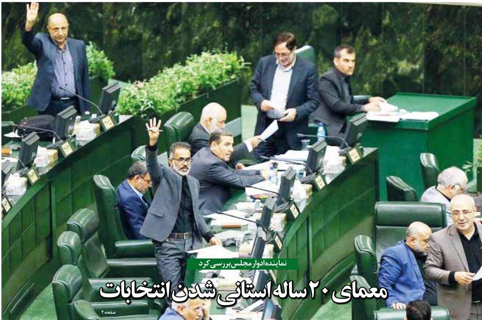
نماینده ادوار مجلس بررسی کرد