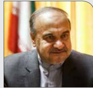
وزیر ورزش و جوانان:

شنبه ۲۲ دی ۱۳۹۷ • سال دوم • شماره ۲۲۶ • ۸ صفحه • ۱۰۰۰ تومان