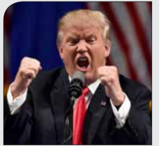
ترامپ با کوبیدن روی میز جلسه رهبران کنگره را ترک کرد