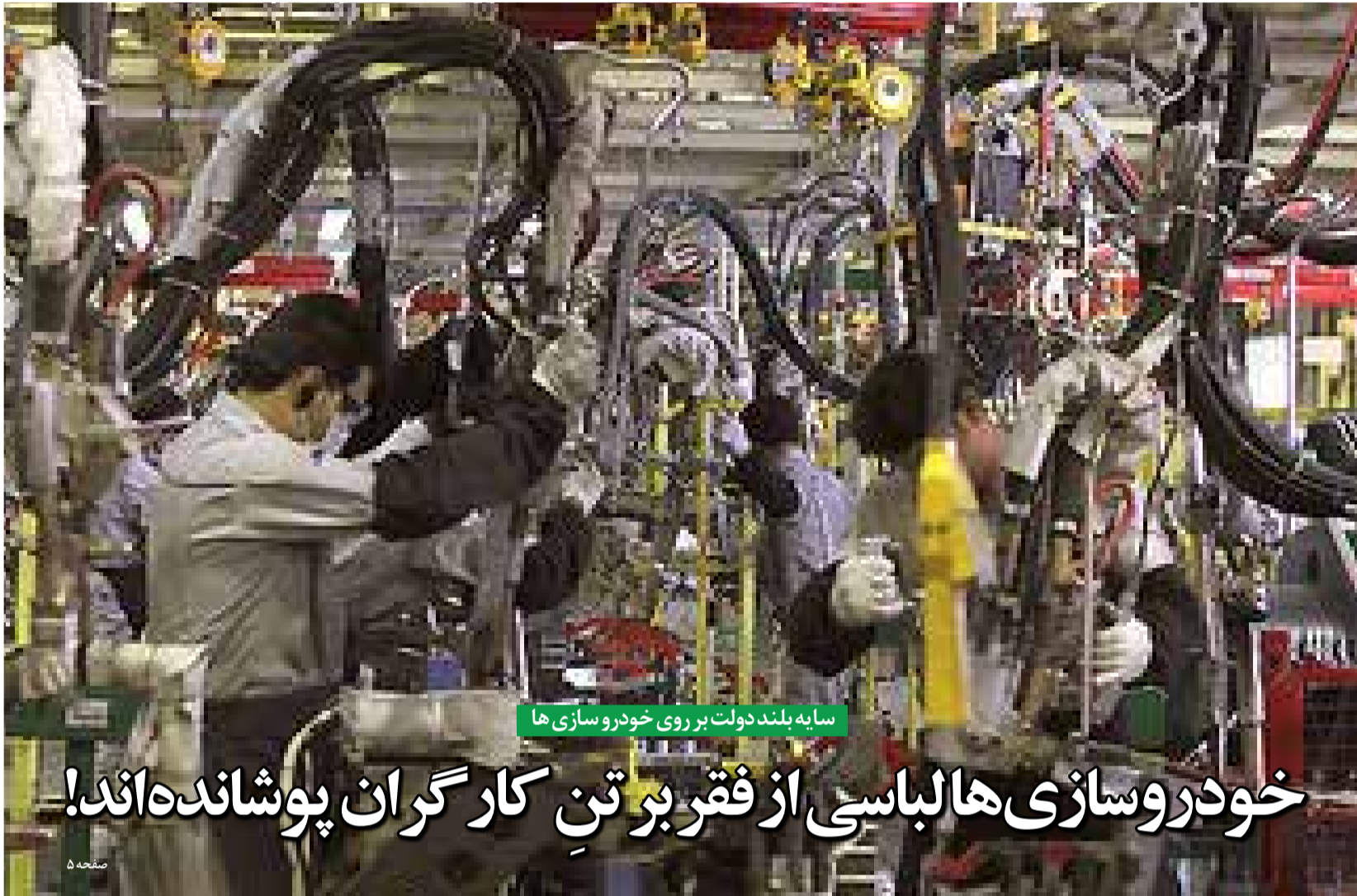
سایه بلند دولت بر روی خودرو سازی ها