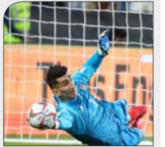
دروازه بان اسبق تیم ملی: