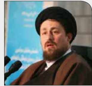
سید حسن خمینی:

شنبه ۲۹ دی ۱۳۹۷ • سال دوم • شماره ۳۲۲ • ۸ صفحه • ۱۰۰۰ تومان