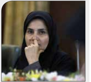
معاون رئیس جمهوری اعلام کرد

در خواست از رئیس مجمع برای تسریع رسیدگی به لایحه پالرمو