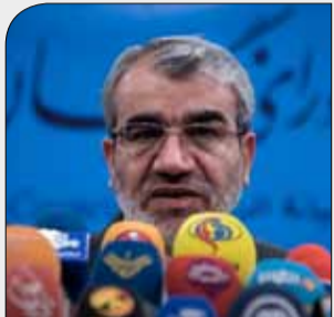
سخنگوی شورای نگهبان: