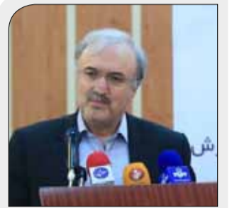
سرپرست وزارت بهداشت: