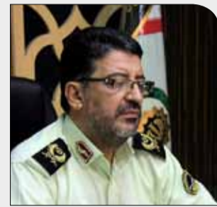
جانشین رئیس پلیس پیشگیری ناجا:

سه‌شنبه ۱۸ دی ۱۳۹۷ • سال دوم • شماره ۳۳۳ • ۸ صفحه • ۱۰۰۰ تومان