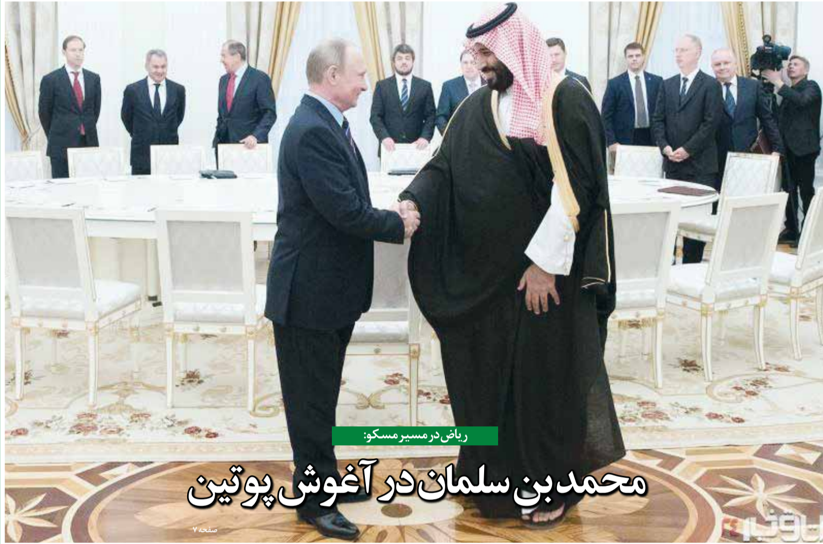
ریاض در مسیر مسکو: