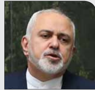
فصل تازه از سریال استیضاح وزرای دولت

دوشنبه ۱۳ آذر ۱۳۹۷ • سال دوم • شماره ۲۹۲ • ۸ صفحه • ۱۰۰۰ تومان