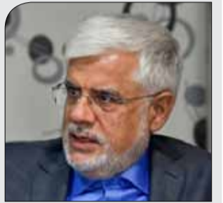
گفت‌وگو با رییس فراکسیون امید مجلس شورای اسلامی

انتقاد عارف از نوع برخوردهای امنیتی و قضایی با کارگران