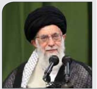
حضرت آیت الله خامنه‌ای:

دشمن در تهاجم به معنویات نیز همچون جنگ سخت، شکست خواهد خورد