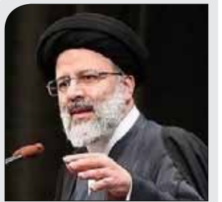
ابراهیم رئیسی در دانشگاه شهید بهشتی: