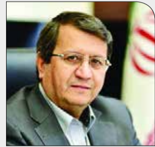
همتی تاکید کرد

شنبه ۱۷ آذر ۱۳۹۷ • سال دوم • شماره ۲۹۶ • ۸ صفحه • ۱۰۰۰ تومان