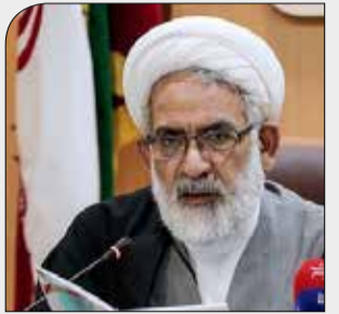
دادستان کل کشور:

نفوذی‌ها تلاش می‌کنند ضربه اقتصادی دشمن را کاری کنند