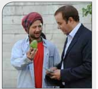
نگاهی به سریال های نوروز ۹۸