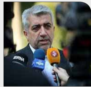
وزیر نیرو اعلام کرد

دوشنبه ۱۰ دی ۱۳۹۷ سال دوم شماره ۳۱۶ ۸ صفحه ۱۰۰۰ تومان