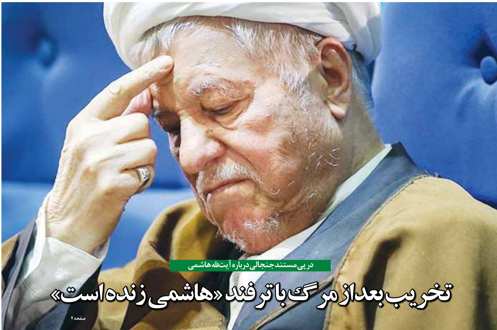
در پی مستند جنجالی درباره آیت‌الله‌هاشمی