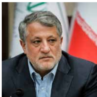
امیدواری کرد که با همکاری شهرداری و استانداری بتوان در این زمینه اقدام کرد.

رئیس شورای اسلامی شهر تهران در بخش دیگری از سخنان خود به ساختار فریه شهرداری تهران اشاره و بیان کرد: ساختار شهرداری تهران چابک نیست و با وجود پرسنل زیاد نمی‌تواند رضایت مردم را کسب کند.