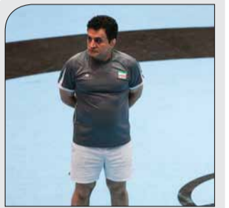
بنا: باید توقعات از تیم ملی پایین بیاید