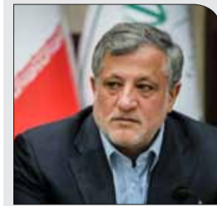
رئیس شورای تهران:

یکشنبه ۲ دی ۱۳۹۷ / سال دوم / شماره ۲۹ / ۸ صفحه / ۱۰۰۰ تومان