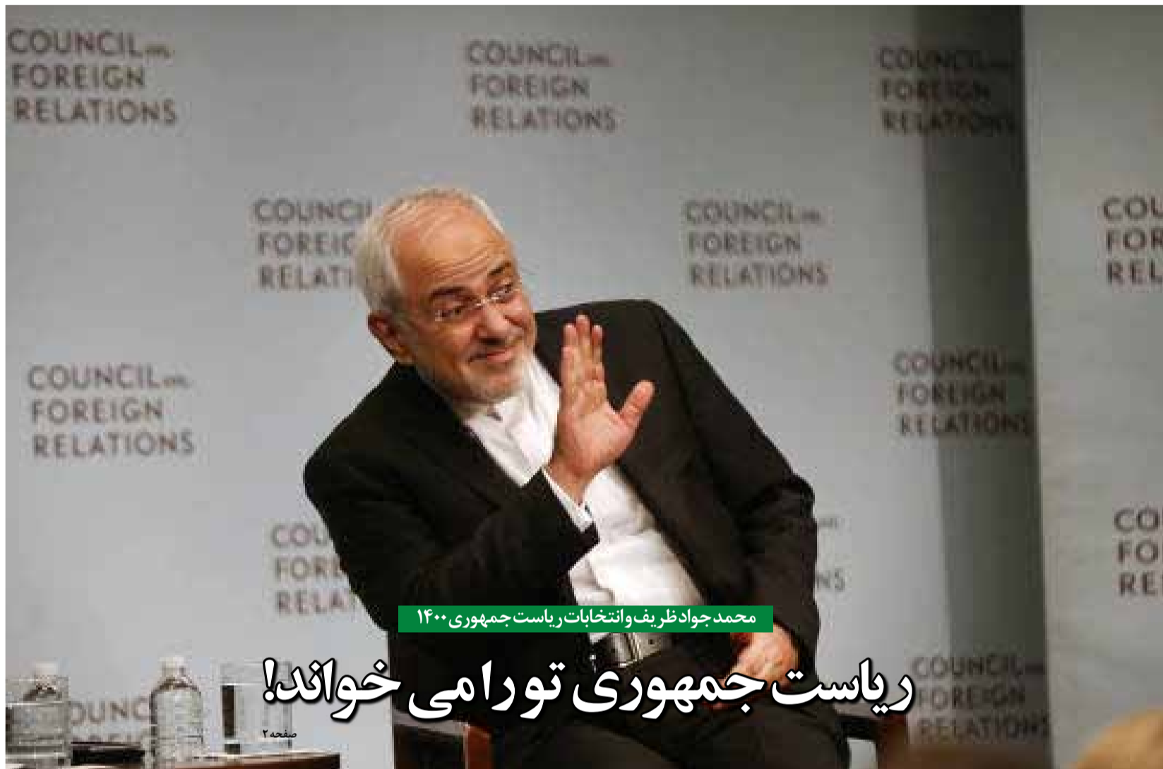
محمد جواد ظریف و انتخابات ریاست جمهوری ۱۴۰۰