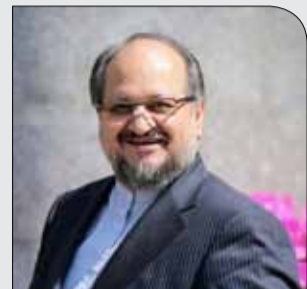
وزیر تعاون، کار و رفاه اجتماعی خبر داد

شنبه ۱ دی ۱۳۹۷ • سال دوم • شماره ۳۰۸ • ۸ صفحه • ۱۰۰۰ تومان