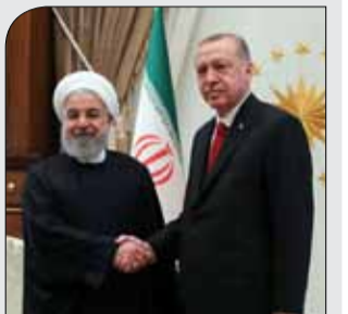
عزم جزم ترکیه برای گسترش و تعمیق روابط مستحکم با ایران

رئیس جمهوری: ایران آماده تامین انرژی ترکیه است