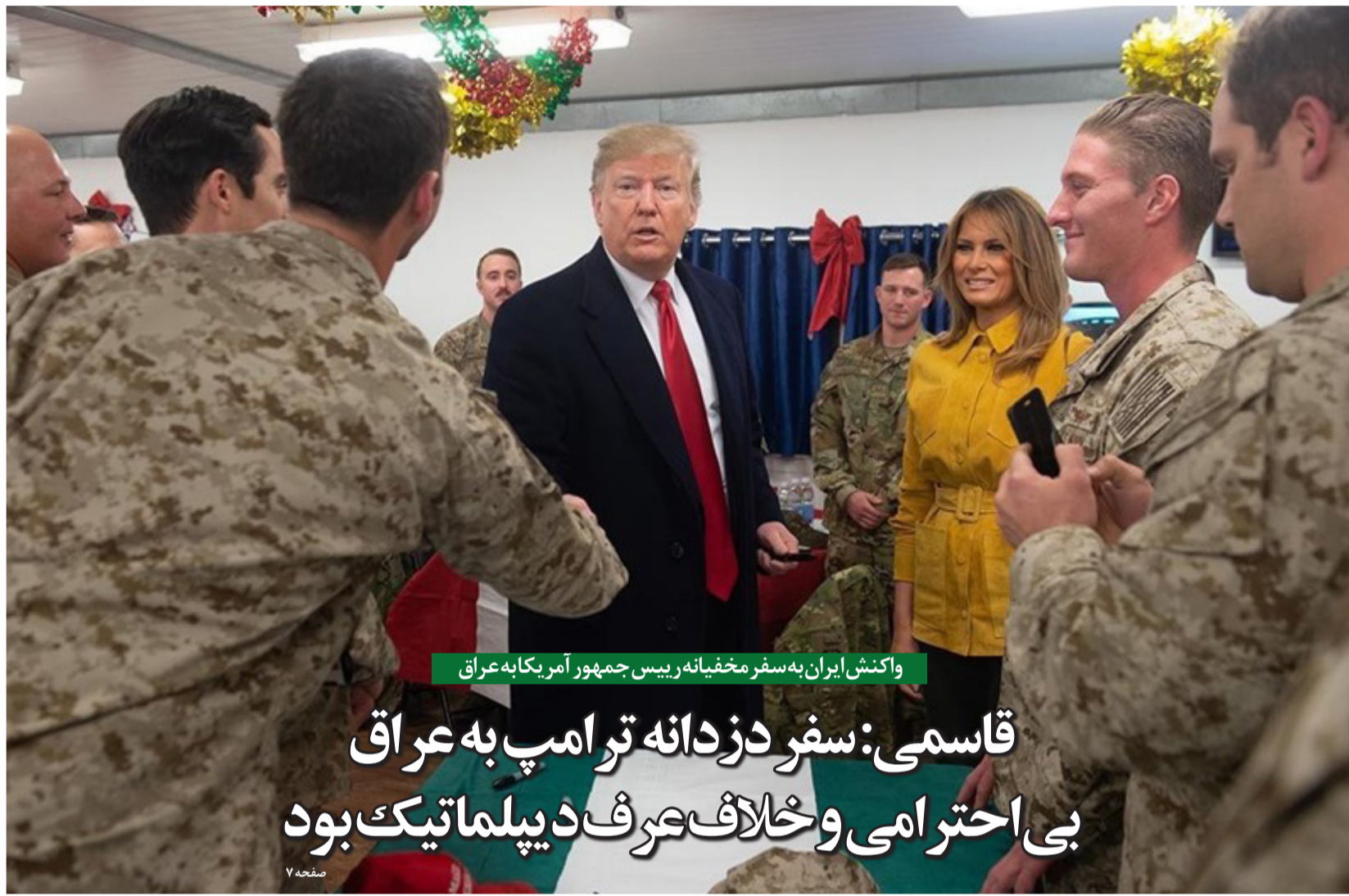
واکنش ایران به سفر مخفیانه رییس جمهور آمریکا به عراق

قاسمی: سفر دزدانه ترامپ به عراق بی احترامی و خلاف عرف دیپلماتیک بود