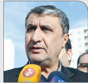
وزیر راه و شهرسازی خبر داد

شنبه ۸ دی ۱۳۹۷ • سال دوم • شماره ۳۱۴ • ۸ صفحه • ۱۰۰۰ تومان