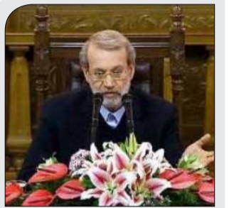
لاریجانی در نشست خبری: