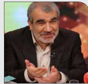
کدخدایی مطرح کرد

سه‌شنبه ۱۳ آذر ۱۳۹۷ • سال دوم • شماره ۲۹۳ • ۸ صفحه • ۱۰۰۰ تومان