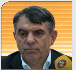
رئیس سازمان خصوصی سازی عنوان کرد

ناگفته‌های صریح درباره واگذاری سرخابی‌ها