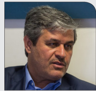
تاجگردون موارد اصلاحی بودجه ۹۸ را تشریح کرد

چهارشنبه ۲۸ آذر ۱۳۹۷ | سال دوم | شماره ۳۰۶ | ۸ صفحه | ۱۰۰۰ تومان