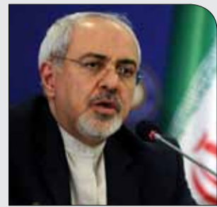
در حاشیه نشست بین‌المللی دوحه

یکشنبه ۲۵ آذر ۱۳۹۷ • سال دوم • شماره ۳۰۳ • ۸ صفحه • ۱۰۰۰ تومان