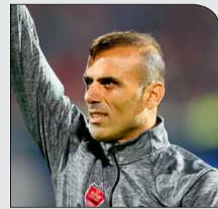
پس از کش و قوس‌های فراوان

یکشنبه ۱۱ آذر ۱۳۹۷ • سال دوم • شماره ۲۹۱ • ۸ صفحه • ۱۰۰۰ تومان