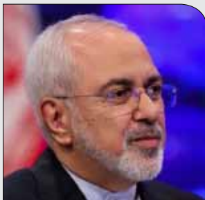
وزیر امور خارجه:

شنبه ۲۴ آذر ۱۳۹۷ • سال دوم • شماره ۳۰۲ • ۸ صفحه • ۱۰۰۰ تومان