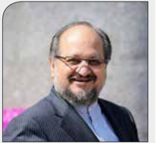
مروری بر وعده‌هایی که شریعتمداری برای ارتقای رفاه داد

عرضه کارت اعتبار طلایی؛ برنامه ویژه در شرایط تحریم