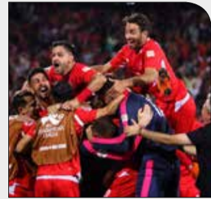
فیفا در گزارشی به فینال لیگ قهرمانان آسیا پرداخت

شنبه ۱۲ آبان ۱۳۹۷ • سال دوم • شماره ۲۷۰ • ۸ صفحه • ۱۰۰۰ تومان