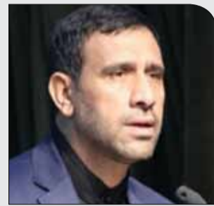
با اکثریت رای

شنبه ۲۶ آبان ۱۳۹۷ • سال دوم • شماره ۲۸۰ • ۸ صفحه • ۱۰۰۰ تومان