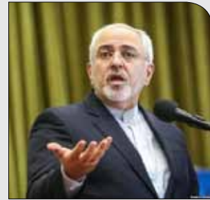
ظریف: برای عادی سازی روابط با عربستان مشکلی نداریم

چهارشنبه ۲۳ آبان ۱۳۹۷ • سال دوم • شماره ۲۷۸ • ۸ صفحه • ۱۰۰۰ تومان