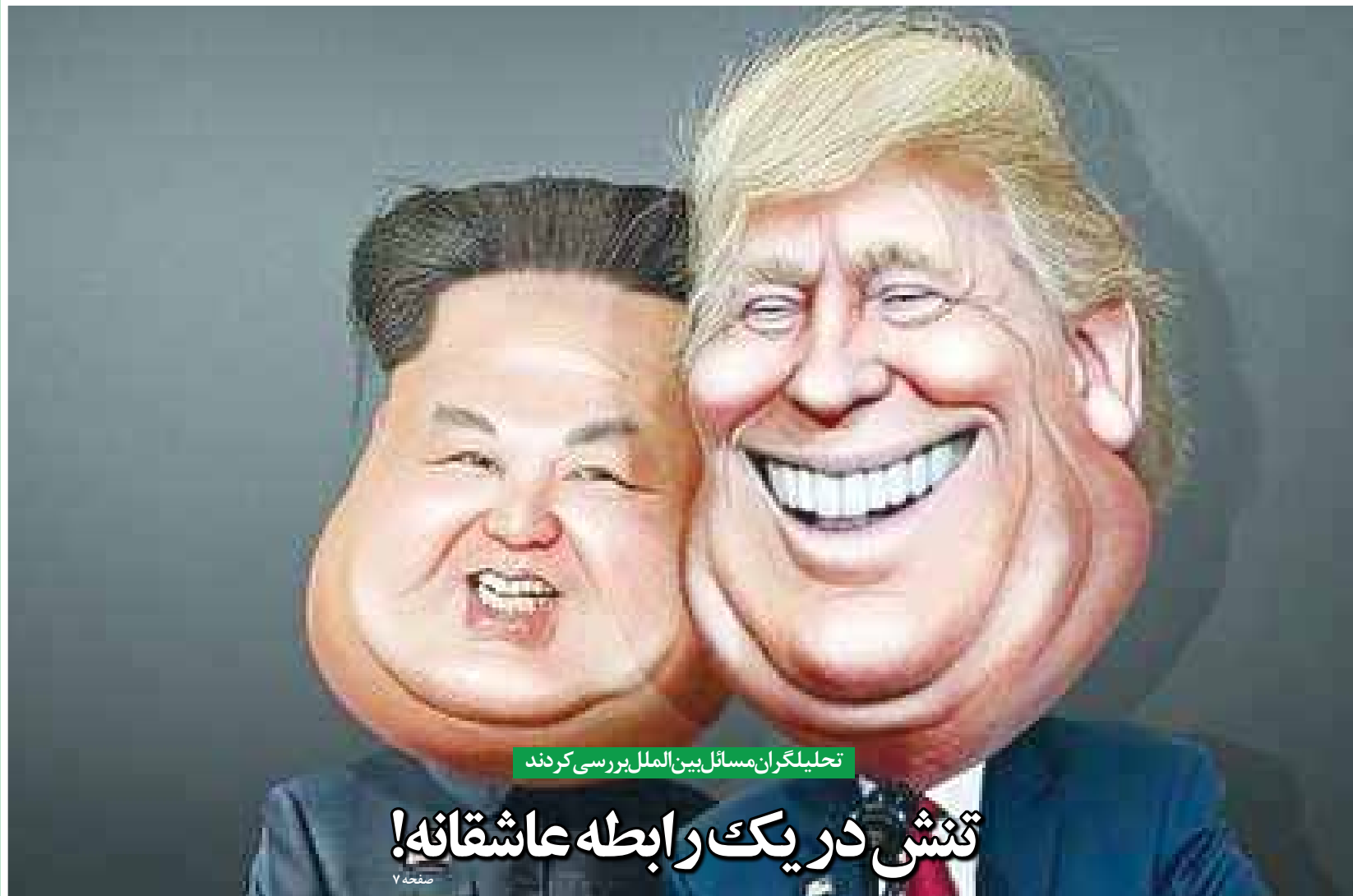
تحلیلگران مسائل بین‌الملل بررسی کردند