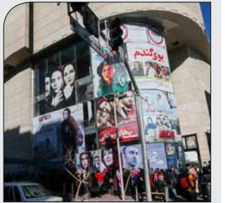
همه فیلم‌ها که نباید اکران شود!

تراکم اکران، فیلم‌سوزی و چند داستان دیگر