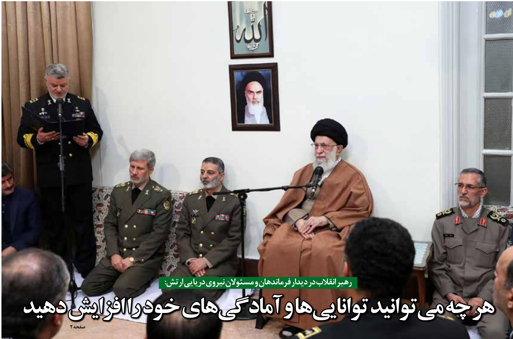
رهبر انقلاب در دیدار فرماندهان و مسئولان نیروی دریایی ارتش: