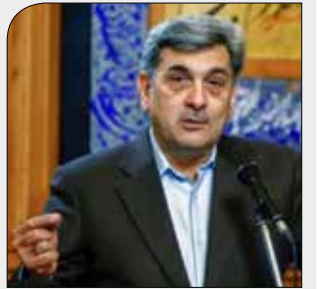
صدور حکم شهردار تهران