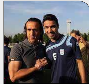
دوست و دشمن کی روش مقابل هم

پنجشنبه ۸ آذر ۱۳۹۷ • سال دوم • شماره ۲۸۹ • ۸ صفحه • ۱۰۰۰ تومان