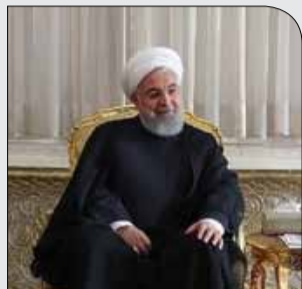
روحانی در پایان نشست سران سه‌قوه:

یکشنبه ۲۰ آبان ۱۳۹۷ • سال دوم • شماره ۳۷۵ • ۸ صفحه • ۱۰۰۰ تومان