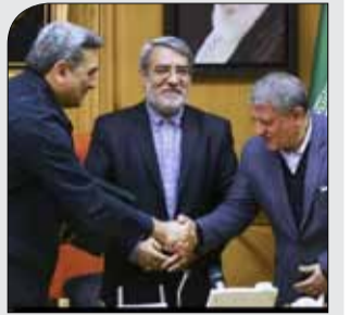
در مراسم اعطای حکم شهردار تهران

وزیر کشور: همه باید از شهردار تهران حمایت کنند