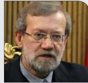
لاریجانی در بدو ورود به تهران:

شنبه ۱۰ آذر ۱۳۹۷ • سال دوم • شماره ۲۹۰ • ۸ صفحه • ۱۰۰۰ تومان