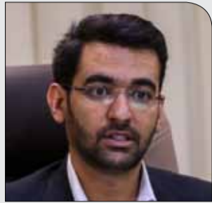
وزیر ارتباطات اعلام کرد

سه‌شنبه ۶ آذر ۱۳۹۷ • سال دوم • شماره ۲۸۷ • ۸ صفحه • ۱۰۰۰ تومان