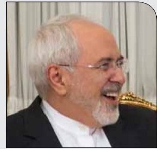
با ۲۴ امضا و در ۱۱ محور

چهارشنبه ۷ آذر ۱۳۹۷ • سال دوم • شماره ۲۸۸ • ۸ صفحه • ۱۰۰۰ تومان