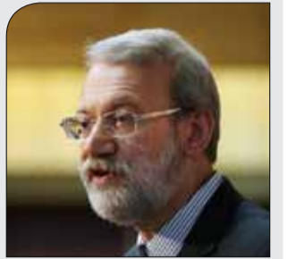
با هشتاد و نه رژیم صهیونیستی و آمریکا

لاریجانی: معامله قلاپی قرن در منطقه شکل نمی گیرد