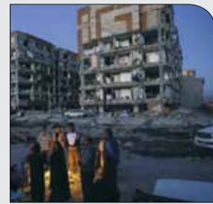
زمین لرزه‌ای به بزرگی ۶/۴ غرب استان کرمانشاه را لرزاند

دوشنبه ۵ آذر ۱۳۹۷ سال دوم شماره ۲۸۶ ۸ صفحه ۱۰۰۰ تومان