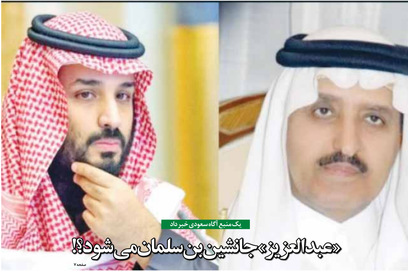
یک منبع آگاه سعودی خبر داد