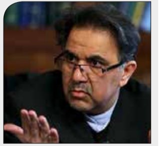
شهردار تهران در دو آیین نامتقارن