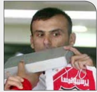
قول می‌دهم هر چه در توانم است انجام دهم

شنبه ۱۹ آبان ۱۳۹۷ • سال دوم • شماره ۲۷۴ • ۸ صفحه • ۱۰۰۰ تومان