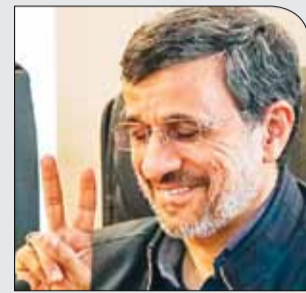
یک عمو مجمع:

یکشنبه ۲۷ آبان ۱۳۹۷ • سال دوم • شماره ۲۸۱ • ۸ صفحه • ۱۰۰۰ تومان