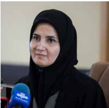
معاون حقوقی رئیس جمهور:

رئیس جمهوری، مرکز خدمات حقوقی بین المللی و وزارت امور خارجه هم باید این آمادگی را داشته باشند تا هر نوع کمک را برای ثبت و ضبط موارد نقض این رای در عرصه سلامت و خدمات پزشکی ثبت کنند تا اولا برای صدور رای اصلی دادگاه و ثانیاً درخواست فرامت و خسارت قابل ارائه به دادگاه باشد. این یک مأموریت جدی و ملی برای همه ما به ویژه دست اندرکاران وزارت بهداشت درمان و آموزش پزشکی است.