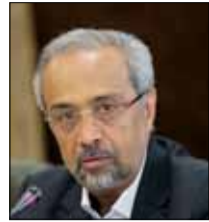
معاون اقتصادی رییس جمهوری: