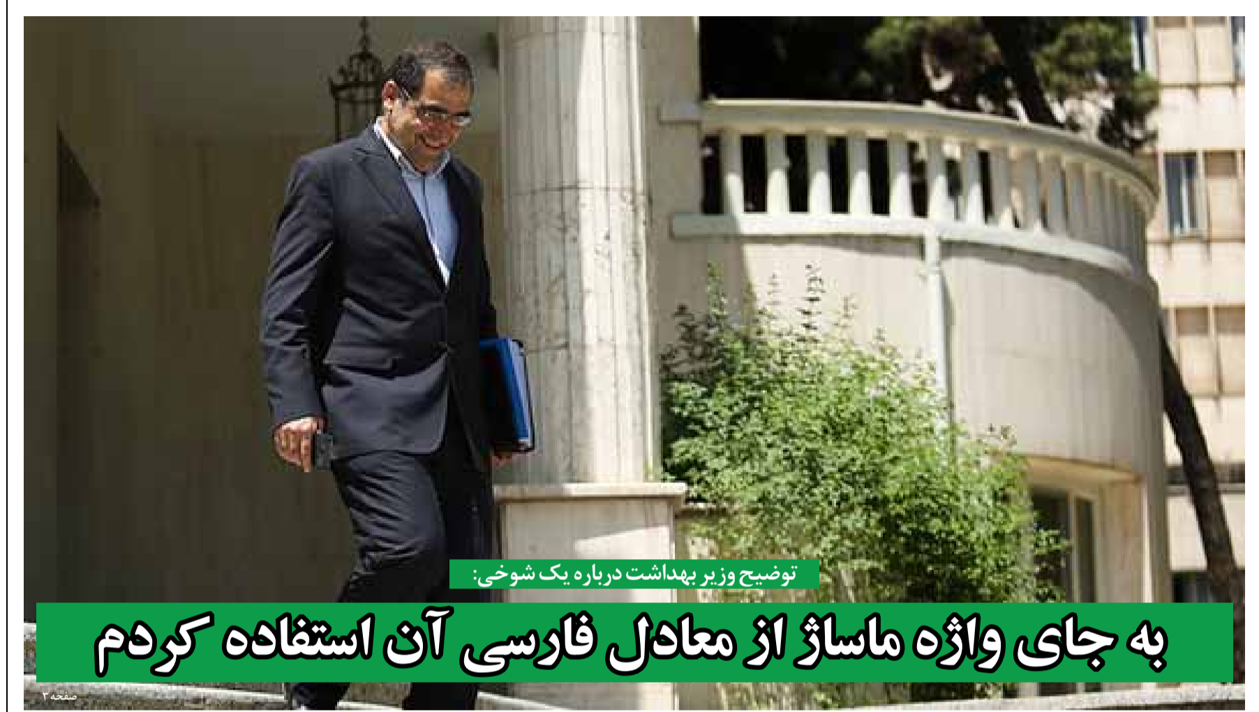
توضیح وزیر بهداشت درباره یک شوخی: