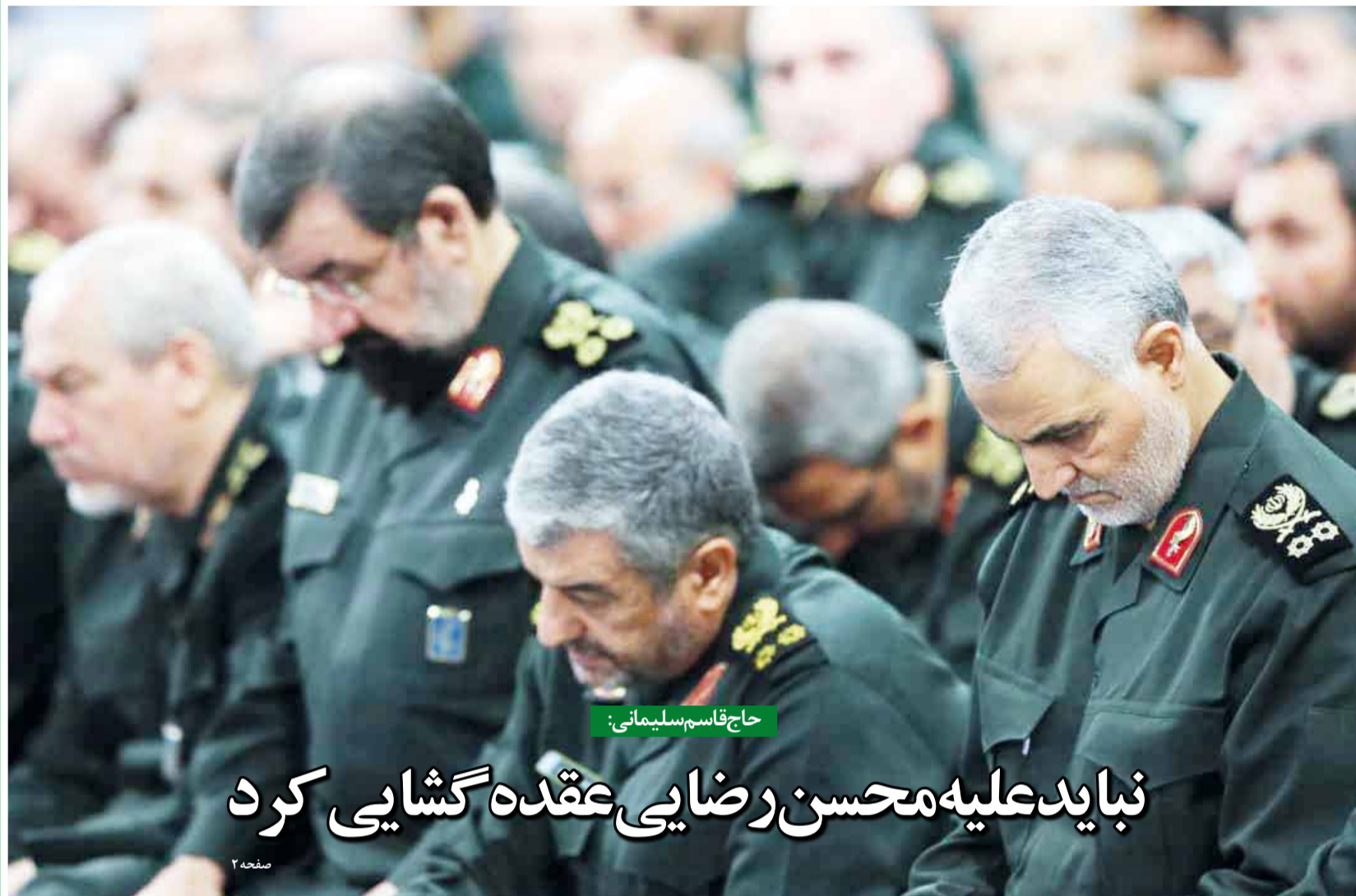
حاج قاسم سلیمانی: