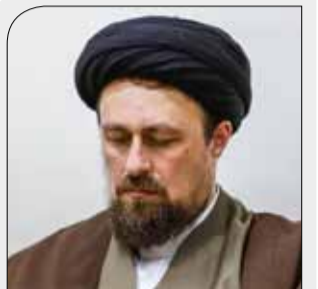
سید حسن خمینی: