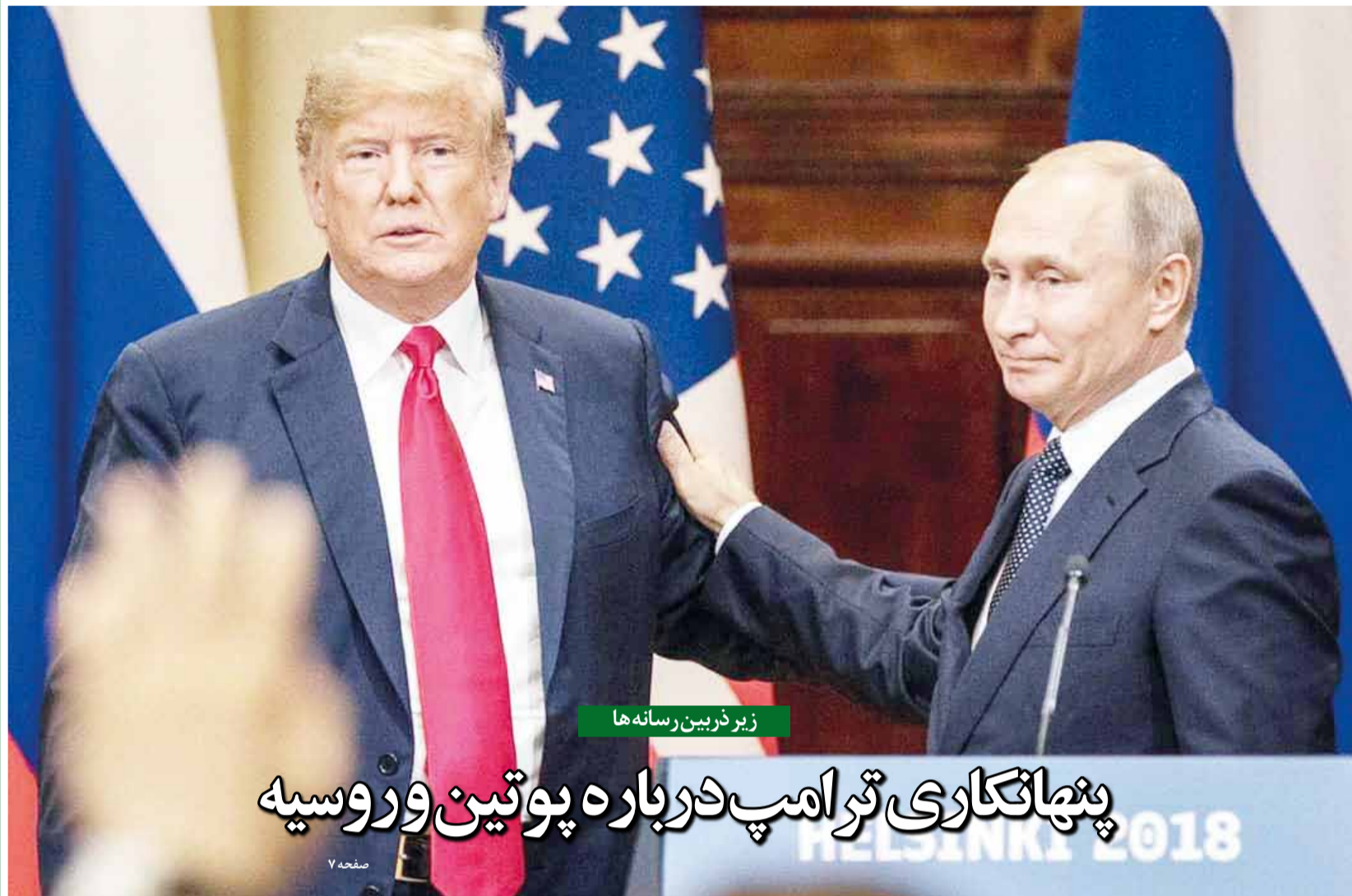
زیر ذریبن رسانه ها